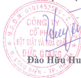
Đào Hữu Huyền