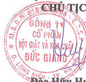
Đào Hữu Huyền