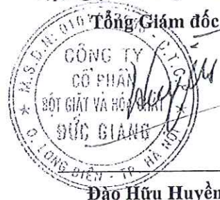
Đào Hữu Huyền