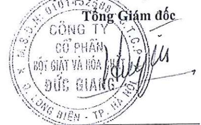
Đào Hữu Huyền