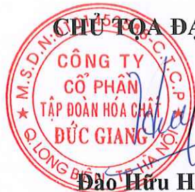
Đào Hữu Huyền