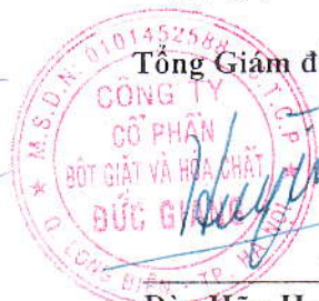
Đào Hữu Huyền