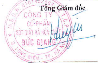
Đào Hữu Huyền