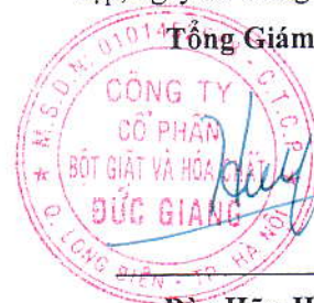
Đào Hữu Huyền